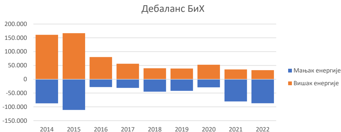
Слика 2: Годишња одступања регулационог подручја БиХ

У табели 8. приказане су вриједности ангажоване балансне енергије, цијене енергије и одговарајући трошкови, узимајући у обзир прекограничне ангажмане због потреба